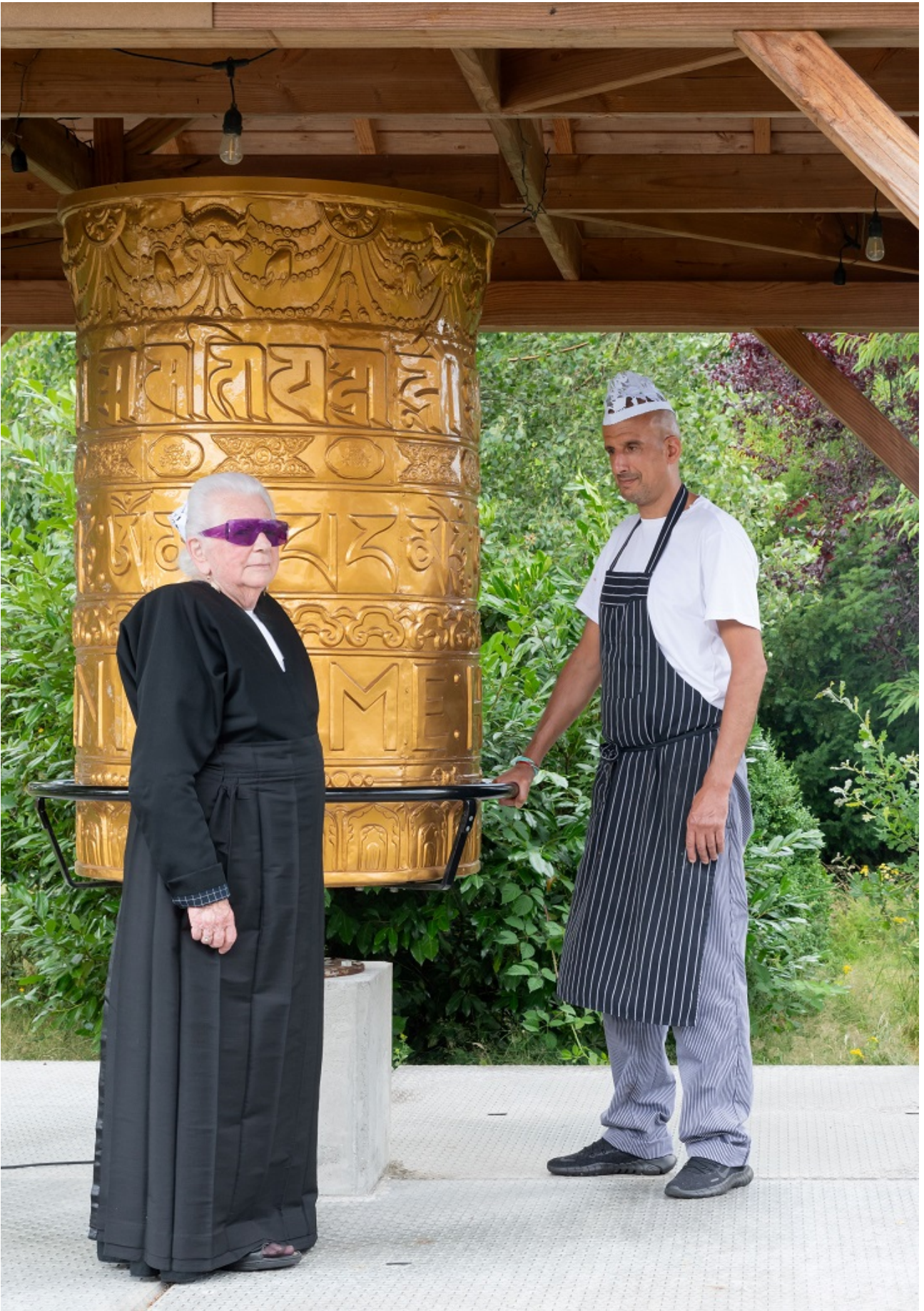
Hendrikje en de kok van het Maitreya Instituut met Spakenburgs mutsje. Het Wilde Oog in het Maitreya Instituut Loenen.