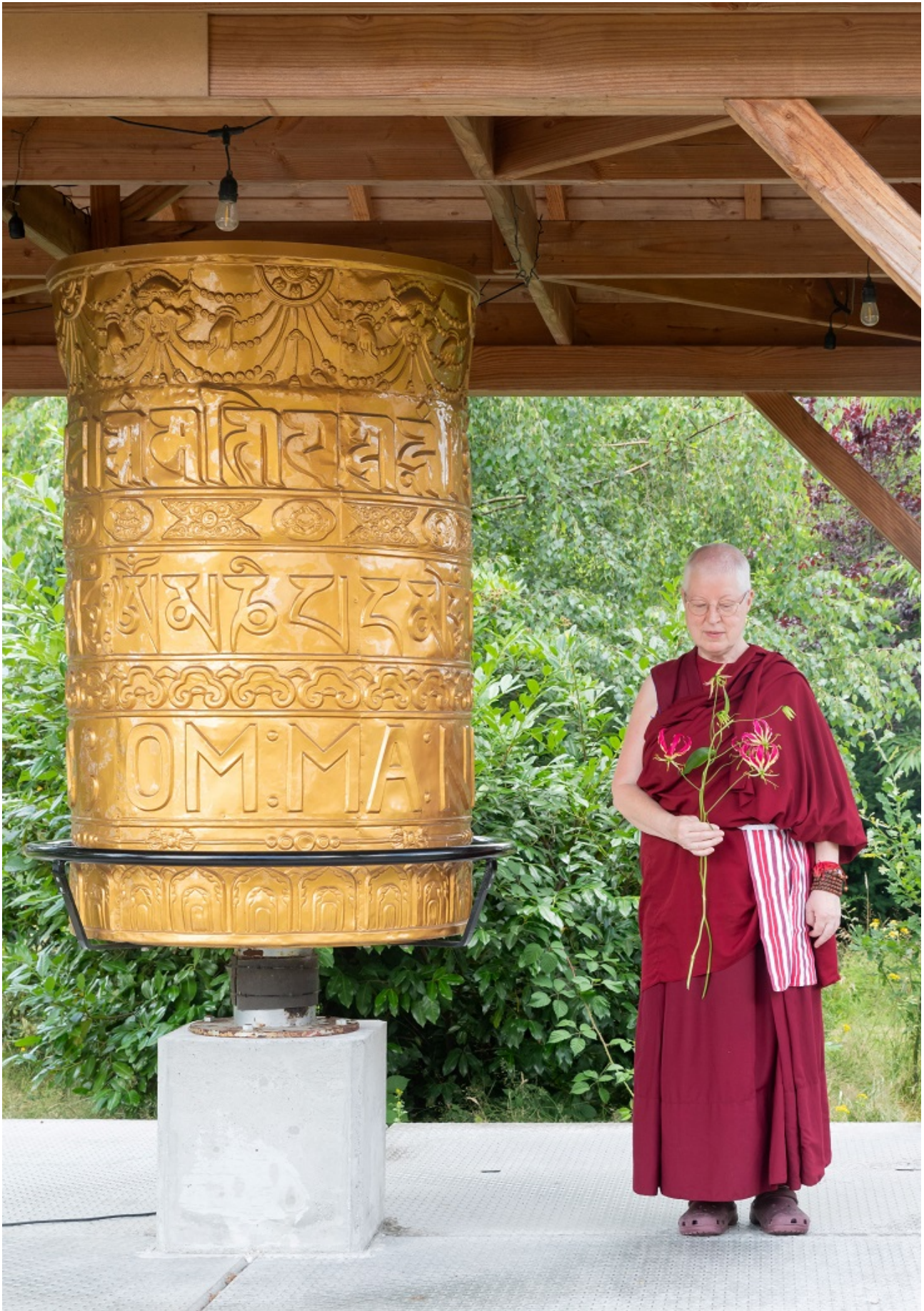
Non met Spakenburgse zak en bloem.