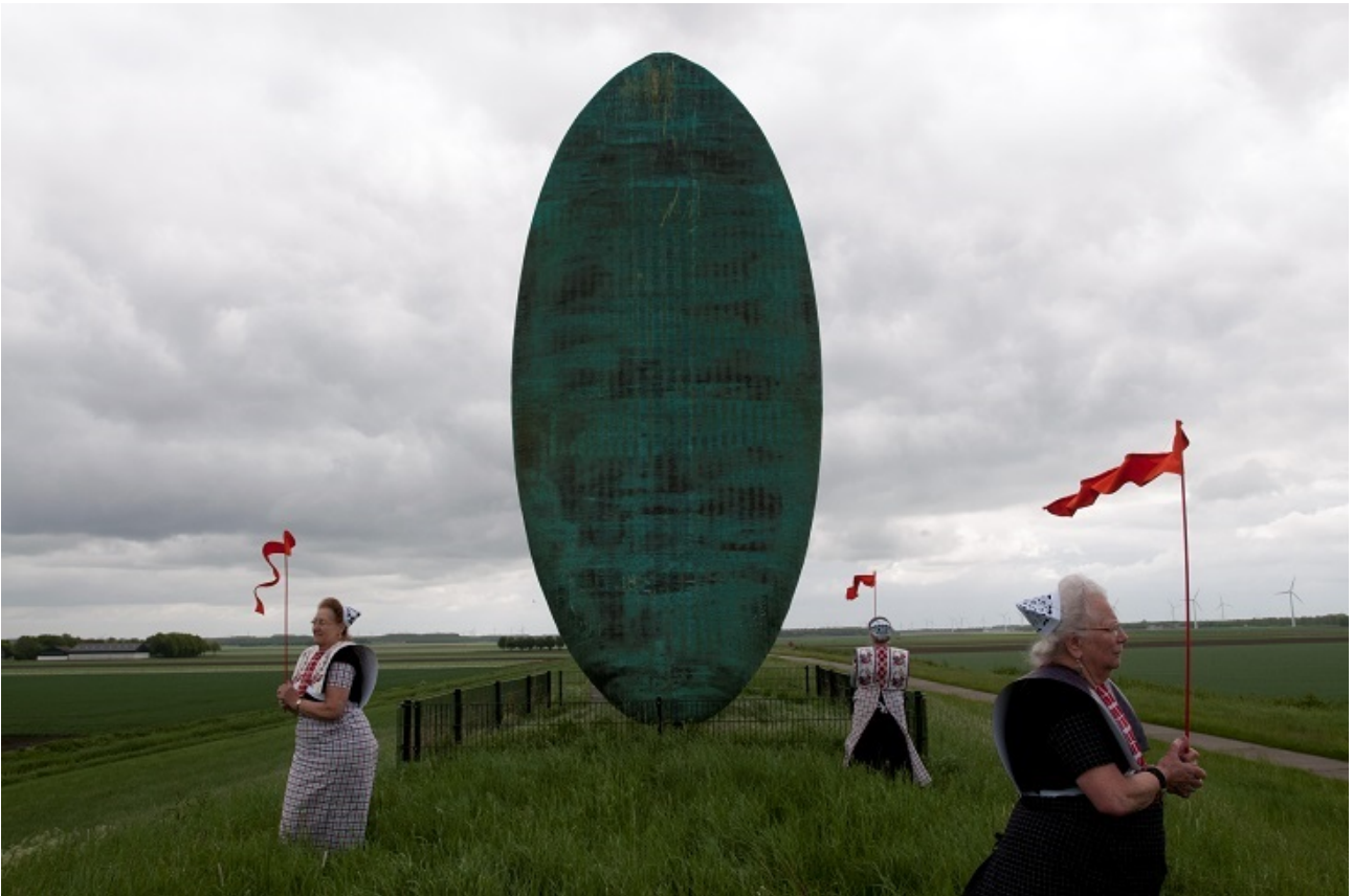
Spakenburgse Diva's bij 'De Tong van Lucifer' van Rudi van de Wint in Lelystad (1993).